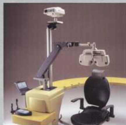
Braccio forottero in posizione di lavoro Phoropter arm in working position