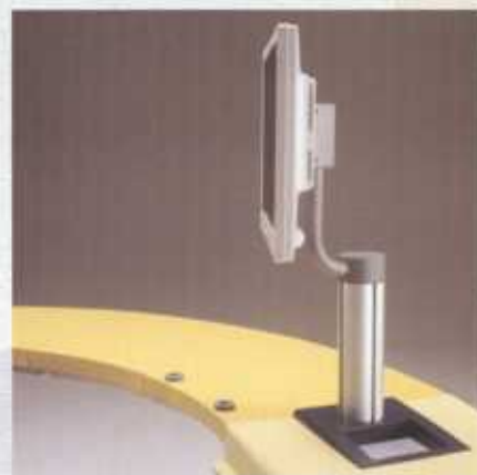
Supporto monitor Monitor support